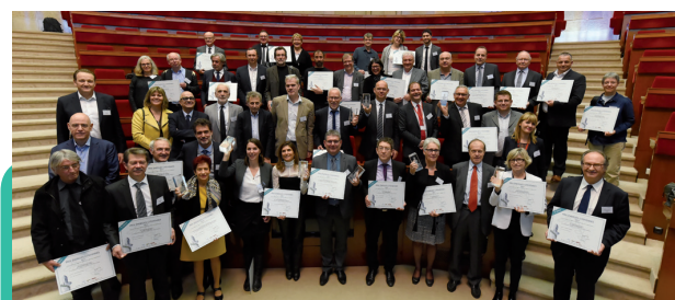
Les candidats autour des membres du Jury