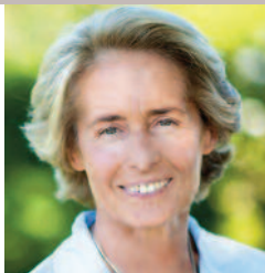
Caroline Cayeux , maire de Beauvais, présidente de la CA du Beauvaisis, présidente de Villes de France