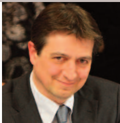
Pascal Bugis , maire de Castres, président de Castres-Mazamet