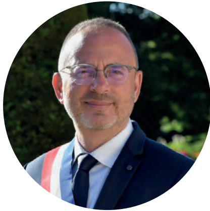
- Yann GALUT, Maire de Bourges