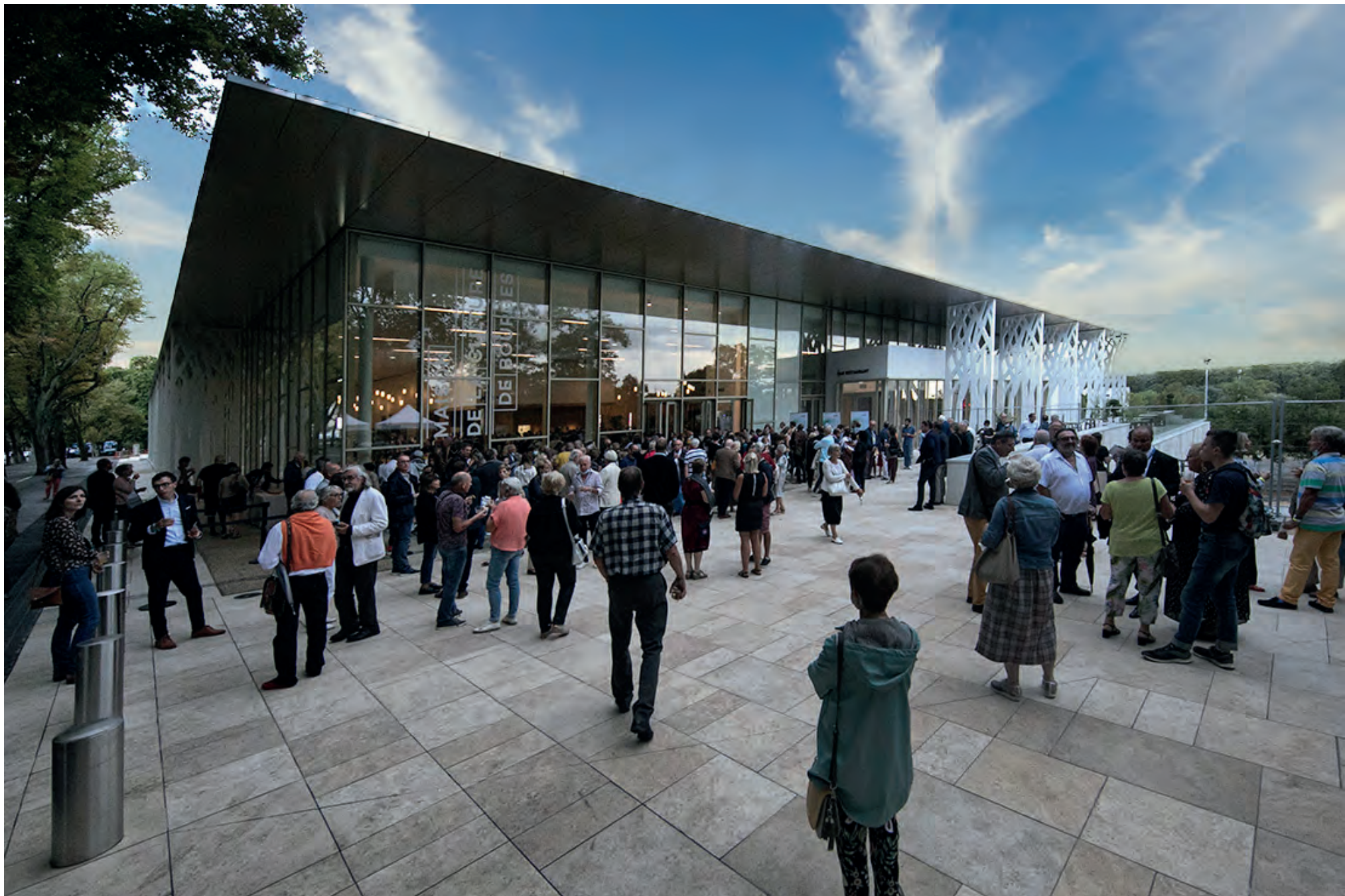
Inauguration de la Nouvelle Maison de la Culture de Bourges, 12 septembre 2021