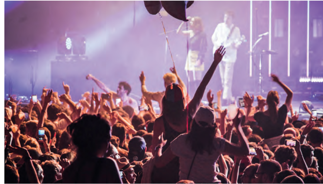
Printemps de Bourges

À l'heure où les industries culturelles et créatives ont dépassé en chiffre d'affaire annuel sur le territoire de l'Union l'industrie automobile et l'aviation, Bourges veut développer un laboratoire de nouvelles pratiques en créant la première Cité européenne des artistes et des auteurs : un lieu ressource unique en Europe développant tous les services dont les artistes et les industries créatives ont besoin pour se développer, dans un maillage européen qui n'est proposé nulle part ailleurs.