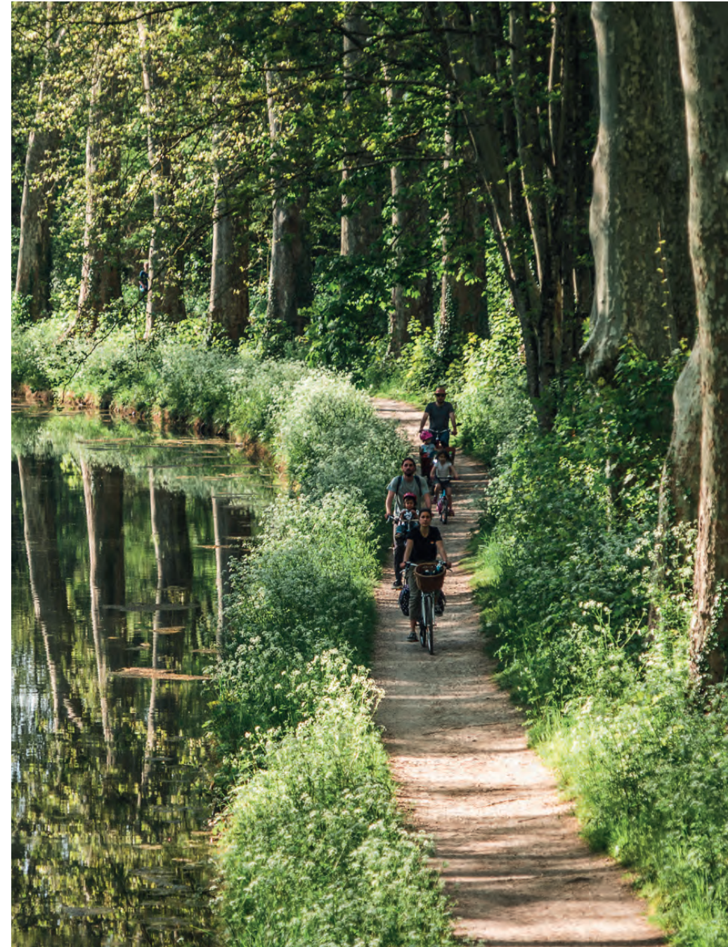
Canal de Berry, un poumon vert dans la Cité de Bourges

Comme Bourges a pu être modélisante en France et en Europe au moment de la création de la Maison de la Culture par André Malraux, ou au moment de la création du Printemps de Bourges.