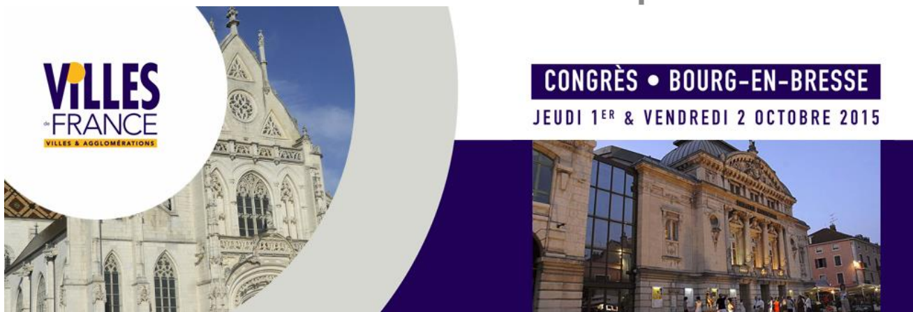
Bourg-en-Bresse, le 1 er octobre 2015 – 15h30