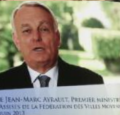
JEAN-MARC AYRAULT, PREMIER MINISTRE ASSISES DE LA FÉDÉRATION DES VILLES MOYENNES JUIN 2013