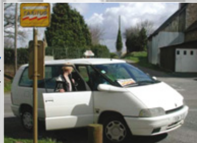
SAINT-BRIEUC Taxis en lignes virtuelles avec rabattement sur des arrêts bus