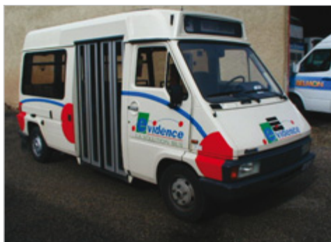
CAHORS Minibus en lignes virtuelles

► La ligne « virtuelle » est un service qui se rapproche des services réguliers ordinaires car elle est organisée sur des arrêts, itinéraires et horaires définis à l'avance. La différence fondamentale avec les Services Réguliers Ordinaires (SRO) est qu'il ne fonctionne qu'à la demande d'un ou plusieurs usagers.