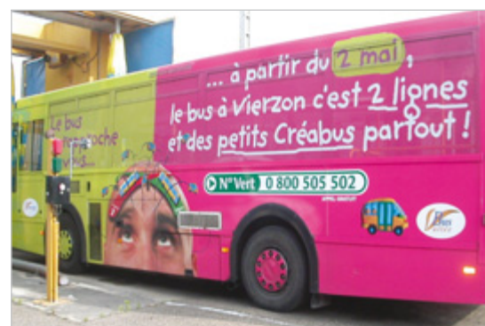
VIERZON Le véhicule de transport à la demande change sa livrée pour devenir une affiche mobile.

Dans la plupart des cas, la collectivité confie l'exploitation du transport à la demande à l'opérateur principal du réseau de transport public, qui l'exécute soit directement, soit confie la prestation à un opérateur tiers, sous-traitant de l'opérateur principal. Dans certaines situations, l'opérateur tiers contractualise directement avec l'autorité organisatrice.