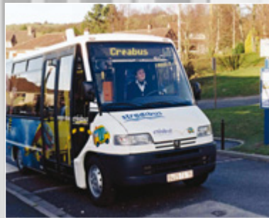
DIEPPE Minibus, service d'arrêt à arrêt, en substitution des lignes régulières notamment aux heures creuses