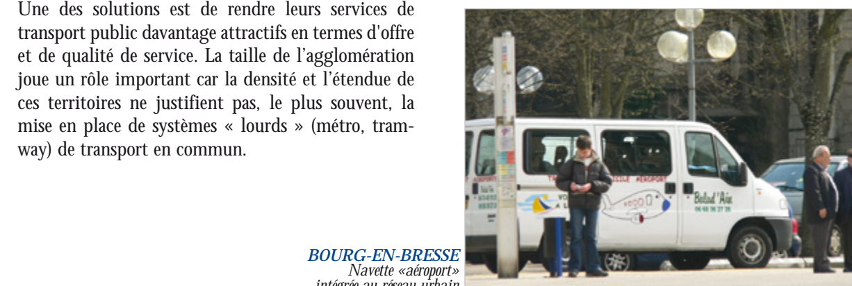
BOURG-EN-BRESSE Navette «aéroport» intégrée au réseau urbain