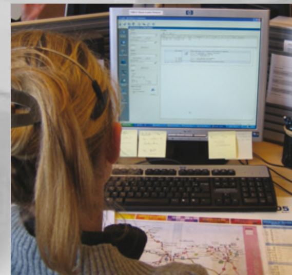
SAINT-BRIEUC Centre d'appel : information voyageur sur l'ensemble du département et prise de réservations pour les transports à la demande.

Porteur d'innovations technologiques (centrale de réservation, logiciel d'exploitation, billetterie...), le transport à la demande est aussi un moyen moderne de s'adapter aux exigences des usagers.