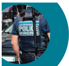
Panorama de la police municipale des Villes de France